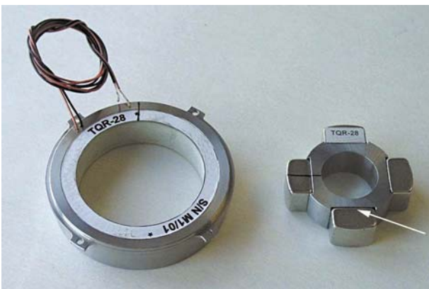
Abb 2.: Bürstenloser Kupplungsmotor für die Übertragung von hohen Momenten. An den Rotor, rechts, werden die Magnete an den Metallring geklebt.

Darüber hinaus stehen für Anwendungen bei denen spannungsausgleichendes Verhalten besonders notwendig ist, z. B. bei großflächigen Verklebungen bzw. bei Verklebungen mit deutlich unterschiedlichen Ausdehnungskoeffizienten der Fügepartner, weitere Produkte zur Verfügung. Auch für Anwendungen, bei denen gutes Fließverhalten und Kapillierverhalten gefragt ist, wie für Taschenmagnete, die z. B. als sicherheitsrelevantes Bauteil in die elektrische Lenkung integriert sind, bietet DELO die passenden Klebstoffe.